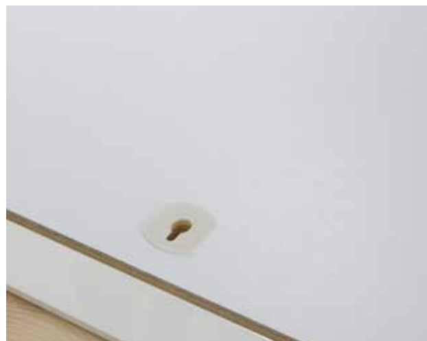
Flächenbündiger Verschluss ohne Zughaken