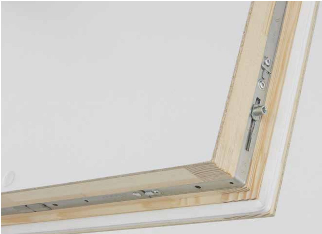
6-Punkt-Fenster-Verriegelung // umlaufende Fensterdichtung // Sandwichdeckel