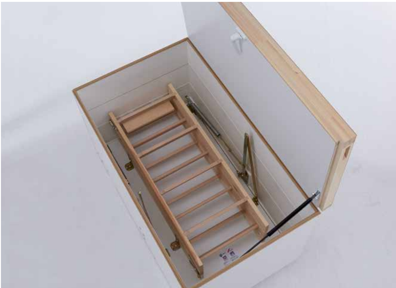
Bodentreppe Designo DD - der obere Deckel verhindert, dass feuchtwarme Luft in den Dachraum strömt